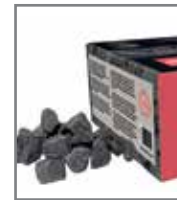
Saunaofensteine AC3000 (20 kg)