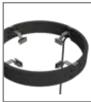
Schutzgeländer HP03 Schutzgeländer mit LED-Leuchten HP03L