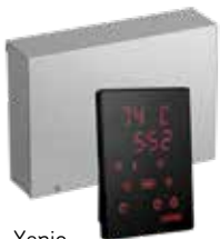
Xenio CX170XW WiFi Steuergerät