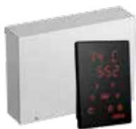
Xenio CX170 Steuergerät