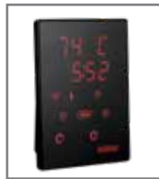
Xenio WiFi Zubehörpaket CX001WIFI