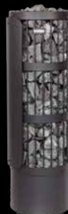
1 x Schutzmantel HP011