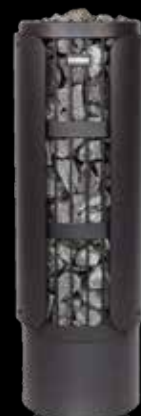
2 x Schutzmantel HP011