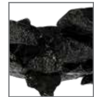
Saunaofensteine Vulcanite AC3040 (20 kg)