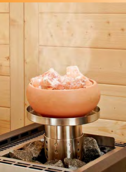
NEU: Sole-Aqua-Premium mit herausnehmbarem Edelstahlzylinder

Beide Systeme sind patentrechtlich geschützt.