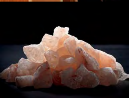
Natursalzsteine von höchster Güte